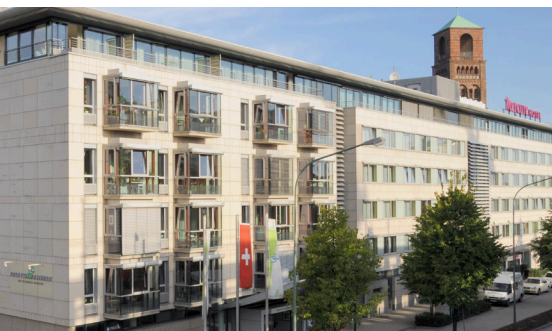
Nova Vita Residenz Am Folkwang Museum Essen