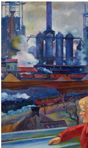
Conrad Felixmüller, Kind vor Hochofen, 1927

Die Ausstellung „Schöne neue Arbeitswelt. Traum und Trauma der Moderne“ im LVR-Landesmuseum Bonn zeigt, wie Künstlerinnen und Künstler auf die tiefgreifenden Veränderungen der Arbeitswelt um 1900 reagierten. Werke unter anderem von Otto Dix und Hannah Höch verdeutlichen, wie aktuell die damaligen Debatten über Arbeit bis heute sind.